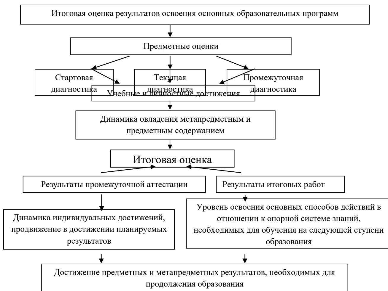
Рисунок. Достижение предметных и метапредметных результатов, необходимых для продолжения образования

При оценке результатов деятельности гимназии №664 её содержательной и критериальной базой выступают планируемые результаты освоения основной образовательной программы. Основными процедурами этой оценки служат аккредитация образовательного учреждения, аттестация педагогических кадров, а также мониторинговые исследования разного уровня.